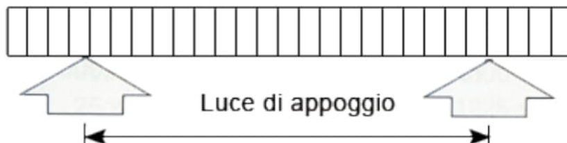
TABELLA DEI CARICHI DISTRIBUITI